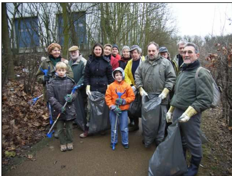
Au Moeraske, la gestion de mars est classiquement consacrée au nettoyage du site. Une mobilisation de masse est toujours la bienvenue (mars 10)

Enfin, citons certains membres du personnel des entreprises Levi Strauss et D'Teteren qui, dans le cadre d'une journée de travail payée par l'employeur mais prestée dans des associations à but environnemental ou social, sont venus gérer sur nos sites.