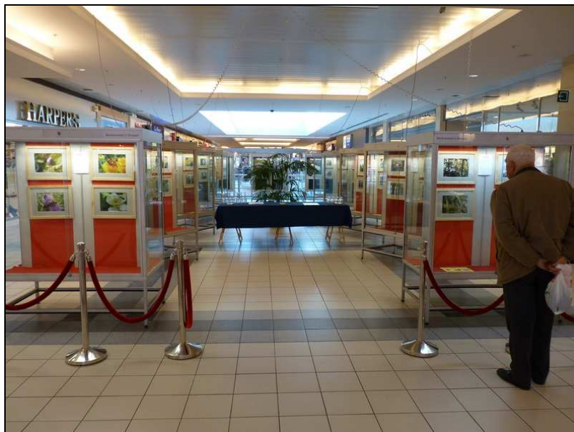
Expo photo sur la biodiversité des sites du Moeraske et de l'Hof ter Musschen au Westland Shopping Center d'Anderlecht (octobre 2010)