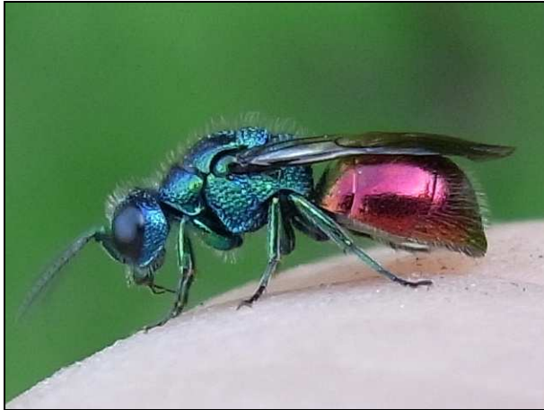
Pseudomalus auratus (24/06/2010 - Moeraske)

In het totaal werden in 2010 1.042 soorten waargenomen. Het hoogtepunt viel op de dag van de Biodiversiteit, 22 mei, waar 109 soorten werden geteld tijdens de actie «Tel mee tot 2010».