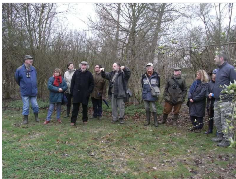
Visite guidée à l'Hof ter Musschen (avril 10)

Des visites sont également organisées à la demande de groupes ou d'associations, dont les activités ne sont d'ailleurs pas nécessairement liées à la protection de la nature et qui désirent mieux connaître la richesse patrimoniale du nord-est de la Région de Bruxelles-Capitale.