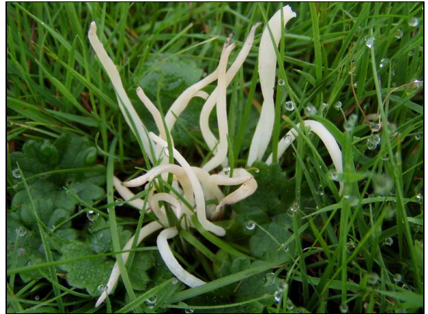
Clavaria fragilis (26/09/2010 - Hof ter Musschen)

Au total, ce sont 1.042 espèces qui ont été observées en 2010. Le pic a été obtenu le jour de la biodiversité, le 22 mai, où 109 espèces ont été comptabilisées durant l'action «Tel mee tot 2010».