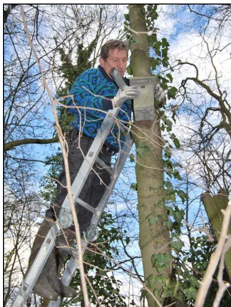
Opération Chlorophylle : L'approche et l'examen du nichoir nécessitent quelques précautions (mars 10)

En 2006, l'opération « Chlorophylle », du nom du lérot héros de bande dessinée, fut lancée. Il s'agissait de placer des nichoirs dans le Walckiers. Le but était de faciliter l'hébergement du lérot ( Eliomys quercinus ) dans cette zone (à l'époque, probablement un, si pas le, dernier endroit situé en Région de Bruxelles-Capitale où un lérot vivant avait été observé récemment).