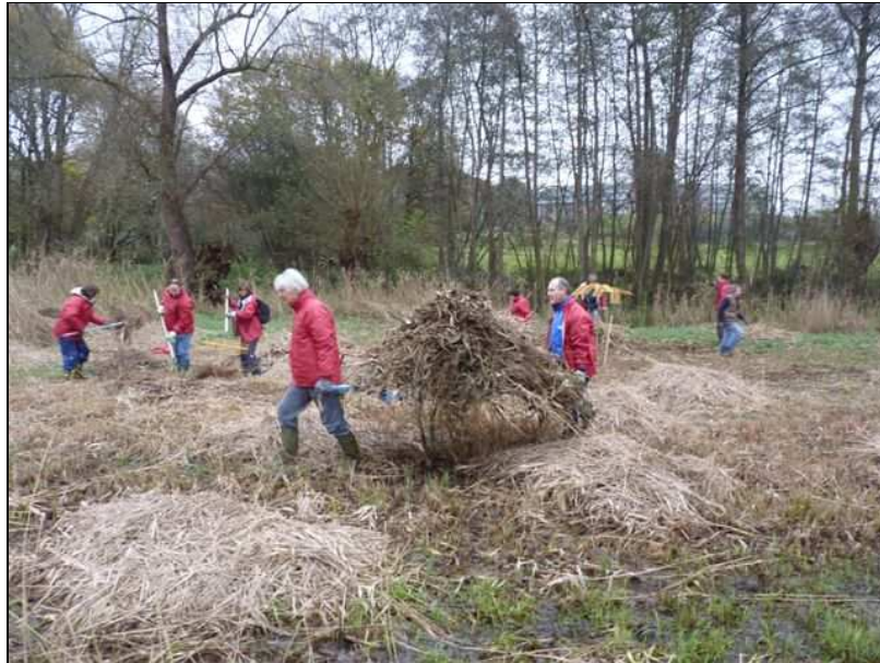
Gestion à l'Hof ter Musschen avec la société D'Ieteren (novembre 10)

Les noms des collaborateurs étrangers participant à la détermination des espèces observées sont repris sur notre site Internet ( www.cebe.be ).