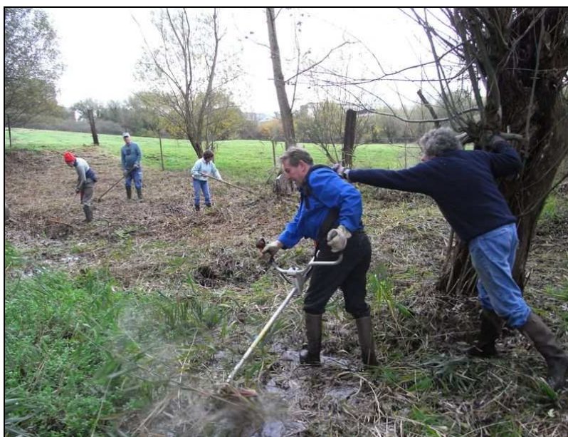
La gestion d'un site naturel est le moment de prendre un bon bol d'air et de faire un peu d'exercice physique (HTM – nov 09)

A la lecture des chiffres des 4 dernières années, on peut remarquer que la fréquentation des gestions mensuelles traditionnelles reste fort stable. Selon les années, c'est l'un ou l'autre des deux sites qui attire plus les « gestionnaires ».