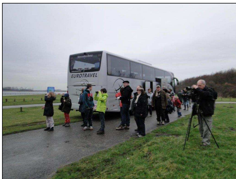
Zélande (NL) – janvier 2014

Le compte-rendu de la sortie ornithologique en Zélande a fait l'objet d'un article dans le bulletin de liaison « l'Echo du Marais » n°109.