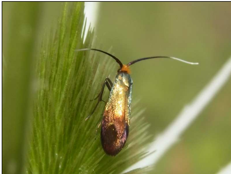
Nemophora cupriacella (MOE – juin 2014)