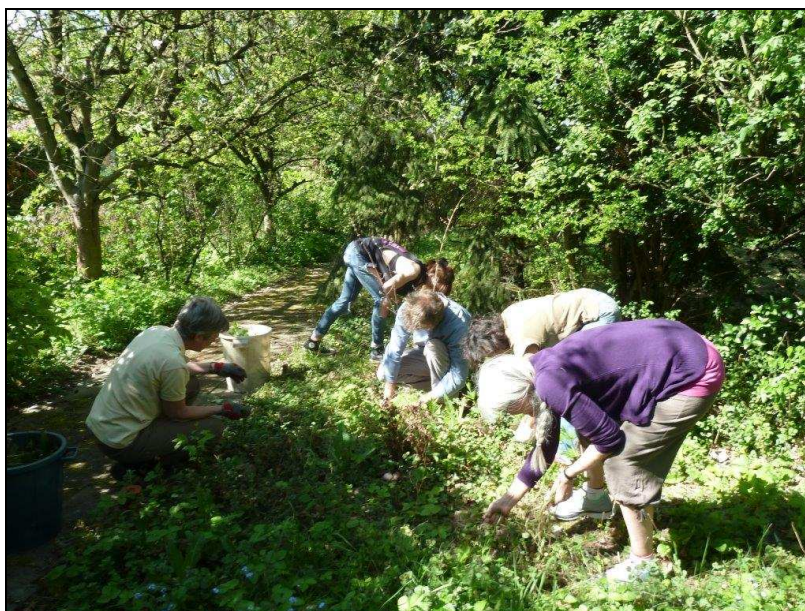
Des associations, telles les chantiers Damien, viennent aussi gérer sur nos sites (ici au potager biologique du Houtweg) (MOE – avril 2014)