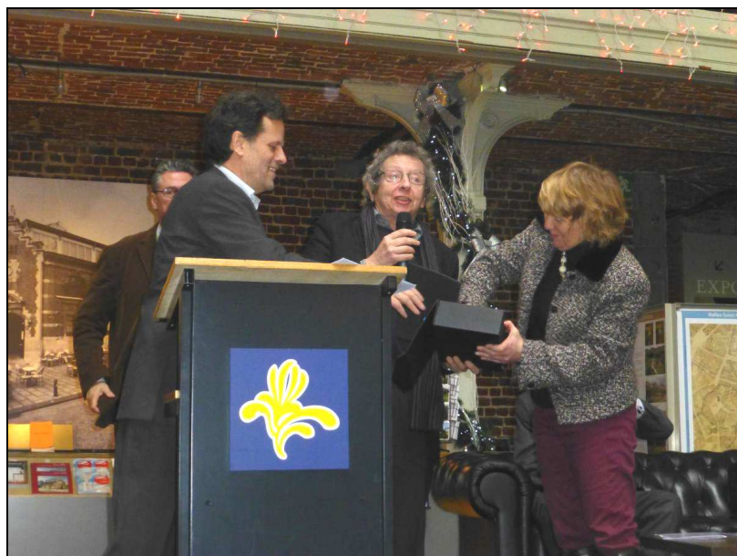
Remise du Prix belge du Paysage entre les mains du président de la CEBE (9/12/2014)

C'est indéniablement une reconnaissance du travail réalisé par notre association et plus spécifiquement sur le site de l'Hof ter Musschen.