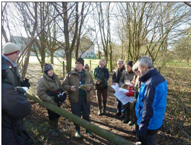
Visite guidée sur le thème des mousses à l'Hof ter Musschen (HTM – mars 2014)

De même, lorsqu'une entreprise vient gérer dans un des sites, une visite de découverte de celui-ci est organisée pour ces gestionnaires d'un jour.